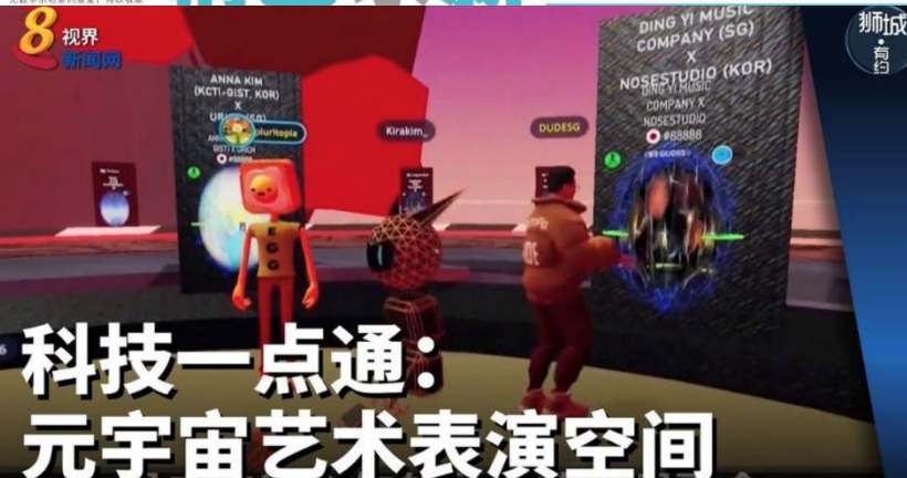
鼎艺团今年最新制作的音乐视频《气》采用双耳录音技术，以增强、演奏者的视觉感，为观众提供3D立体沉浸式体验。

15年前，一群南洋艺术学院华乐系的毕业生创立了鼎艺团，立足本土，放眼世界。15年后的今天，他们交出了亮眼的成绩单——实现跨国际、跨文化的艺术合作，为不同年龄观众策划乐季，经历了疫情的磨炼，灵活的思维结合了科技与技艺，为观众呈现新颖的表演形式，赢得掌声与喝彩。