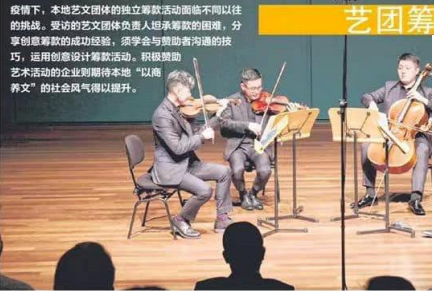
在30周年重新出发的第四周年，今年首次举办新音乐音乐会。