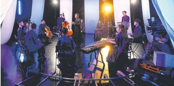
鼎艺团今年最新制作的音乐视频《气》采用双耳录音技术，以增强、演奏者的视觉感，为观众提供3D立体沉浸式体验。