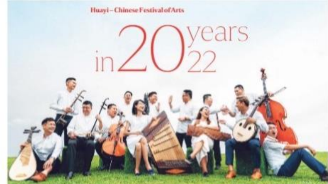
鼎艺团今年最新制作的音乐视频《气》采用双耳录音技术，以增强、演奏者的视觉感，为观众提供3D立体沉浸式体验。