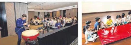
在30周年重新出发的第四周年，今年首次举办新音乐音乐会。