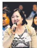
在30周年重新出发的第四周年，今年首次举办新音乐音乐会。

全球疫情至今未见明确拐点，战火还在远方弥漫。面对充满不确定性的前路，艺术团体如何能持续生存？艺术团体如何在疫情中长远发展，以培养年轻理想社会我们还有多少？