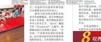
在30周年重新出发的第四周年，今年首次举办新音乐音乐会。