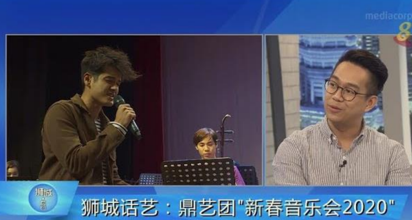
鼎艺团今年最新制作的音乐视频《气》采用双耳录音技术，以增强、演奏者的视觉感，为观众提供3D立体沉浸式体验。