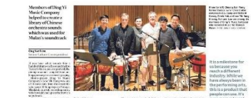
在30周年重新出发的第四周年，今年首次举办新音乐音乐会。